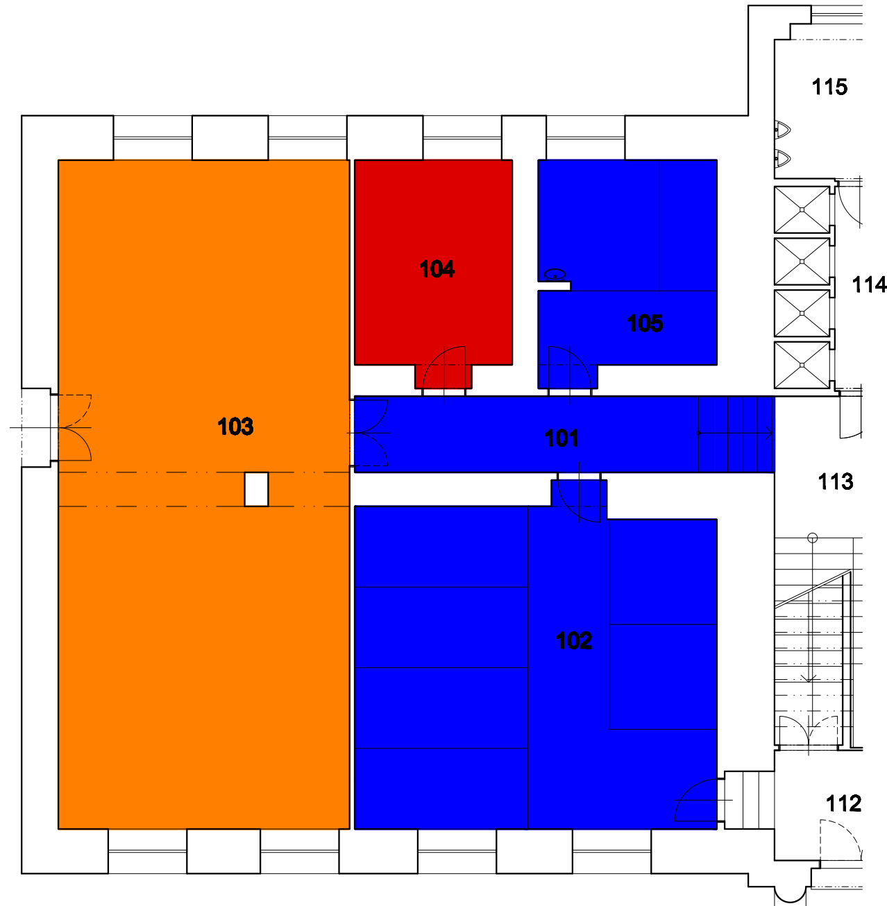
Objekt B – INTERNÁT (STARÁ ČÁST)