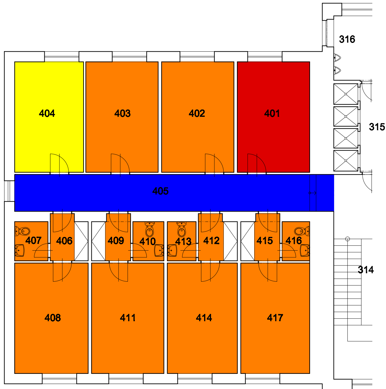
Objekt B – INTERNÁT (STARÁ ČÁST)